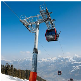
GD10 Wagstättbahn, Kitzbühel/AT