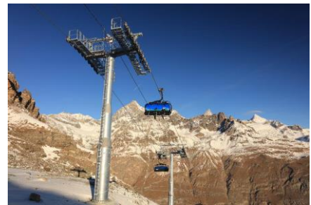
CD6C Joscht-Hirli, Zermatt/CH

Der LEITNER DirectDrive arbeitet mit einem Synchronmotor, der direkt mit der Seilscheibe verbunden ist. Er besteht aus drei bewegten Teilen, dem Rotor und zwei Lagern. Die für ein konventionelles Planetengetriebe erforderlichen Motorölmengen entfallen komplett. Da der LEITNER DirectDrive mit weniger Teilen und niedrigerer Drehzahl arbeitet, reduzieren sich Verschleiß und Ausfallrisiko deutlich. Neben der höheren Zuverlässigkeit überzeugt er auch mit einer wesentlich geringeren