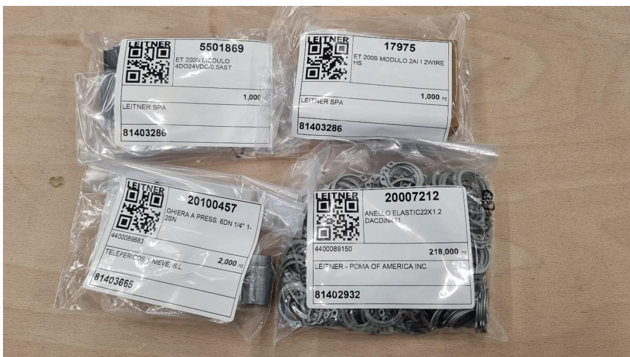
Fig.1 Esempi di articoli pronti alla spedizione

siamo lieti di informarvi di una novità per quanto riguarda l'etichetta per la spedizione dei prodotti. Per rendere sempre più efficiente il sistema di spedizione e facilitare la ricerca del materiale una volta giunto in sito, abbiamo introdotto una nuova etichetta che sarà presente su ogni articolo ordinato (Fig. 1).