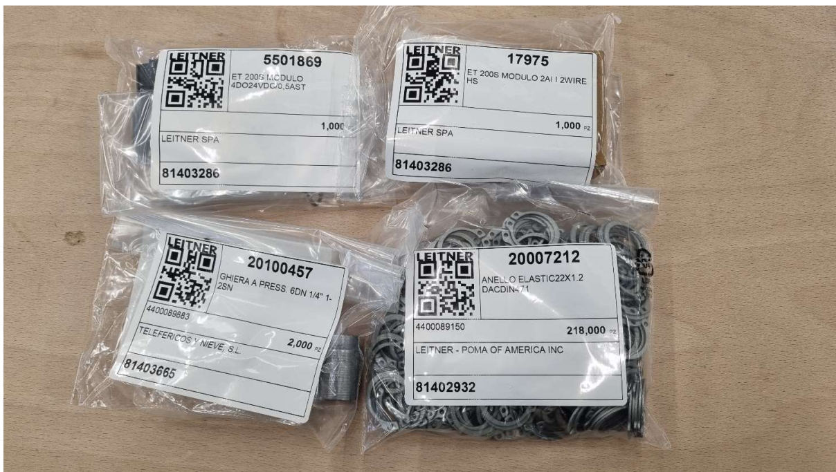
Abb.1 Beispiel für versandfertige Artikel

wir freuen uns Ihnen mitteilen zu können, dass wir ein neues Produktlabel eingeführt haben. Um das Versandsystem effizienter zu gestalten und das Auffinden des Materials nach der Ankunft vor Ort zu erleichtern, wird dieses neue Etikett nun auf jedes Material vorhanden sein (Abb. 1).