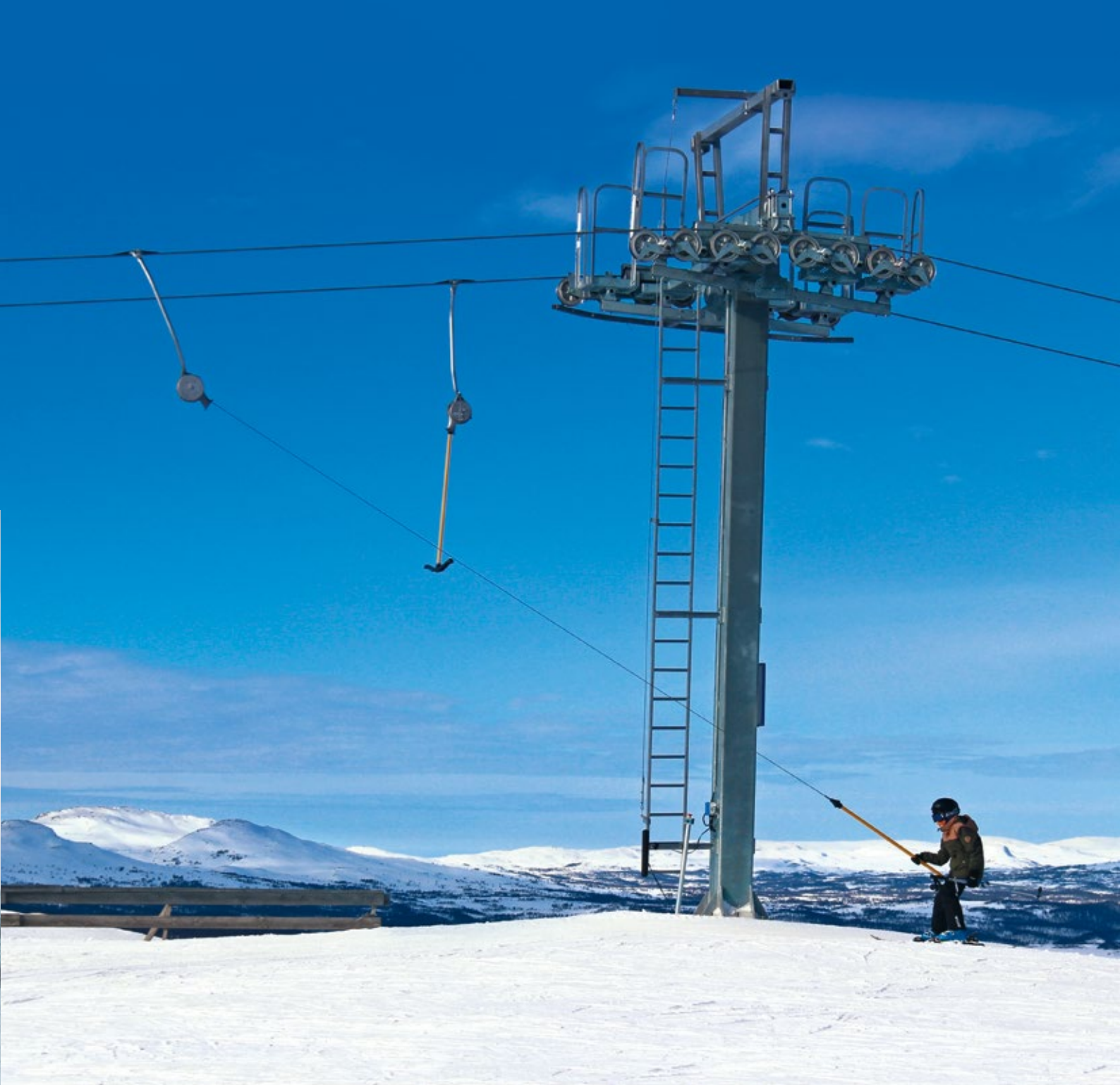
SL2 HAMRAFJÄLLET | TÄNNDALEN (SE)